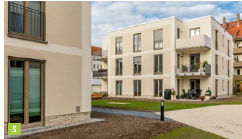
01 Leipzig – Wohnfabrik